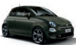
149 Vert Alpes Matt (mit 6U9)