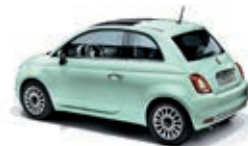
166 Vert Lattementa