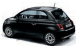
876 Nero Vesuvio