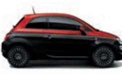
246 Nero Vesuvio / Rosso Passione