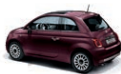
866 Bordeaux Opera