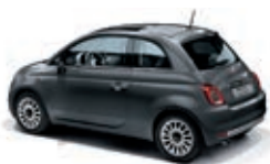
695 Grigio Pompei