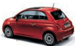
111 Rosso Passione