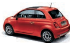
552 Rosso Corallo