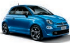
425 Blu Italia