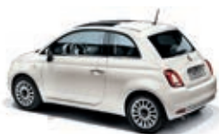
268 Bianco Gelato