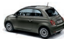
372 Grigio Colosseo