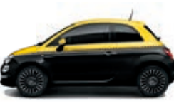
433 Nero Vesuvio / Giallo Sole