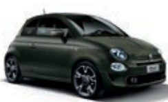
149 Verde Alpi Opaco (con 6U9)