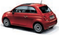
111 Passione Rot