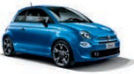
425 Italia Blau