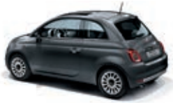
695 Pompei Grau