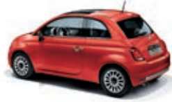
552 Corallo Rot