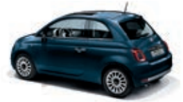
687 Dipinto di blu Blau