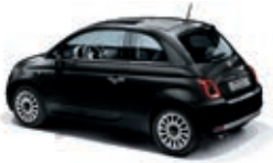
876 Vesuvio Schwarz