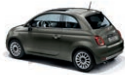
372 Colosseo Grau