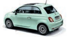
166 Lattementa Grün