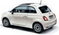
268 Gelato Weiss