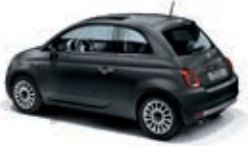
735 Carrara Grau