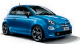
425 Blu Italia