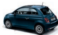
687 Blu Dipinto di blu